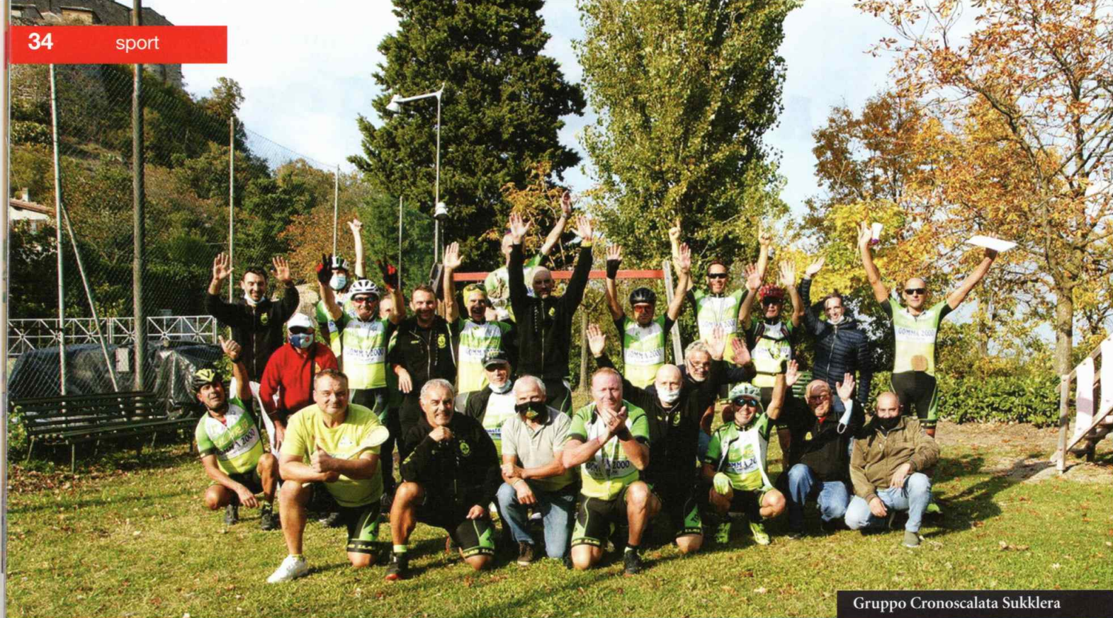
Gruppo Cronoscalata Sukklera