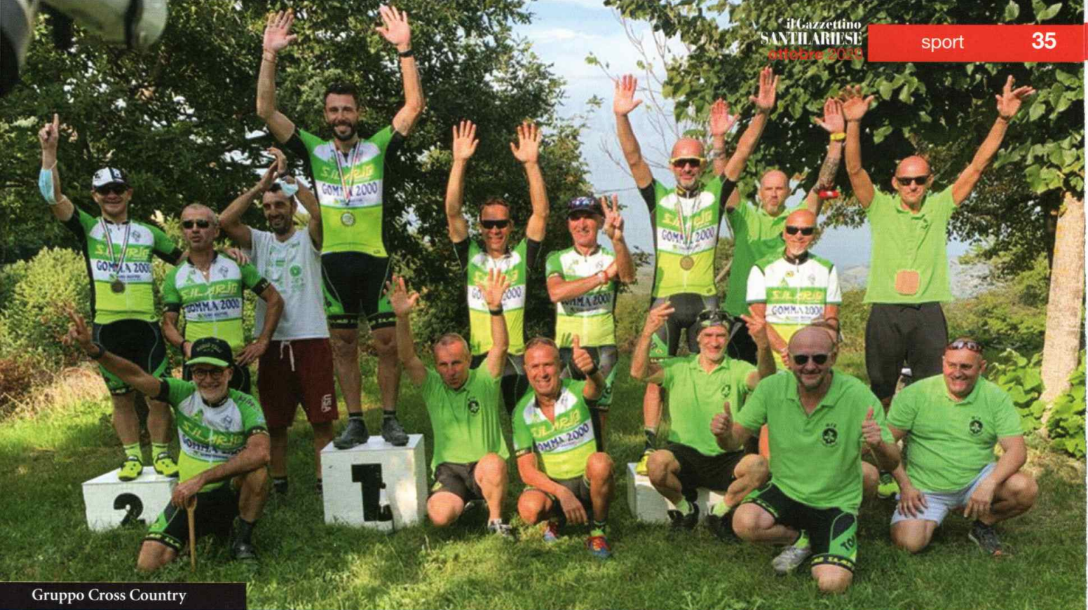
Gruppo Cross Country